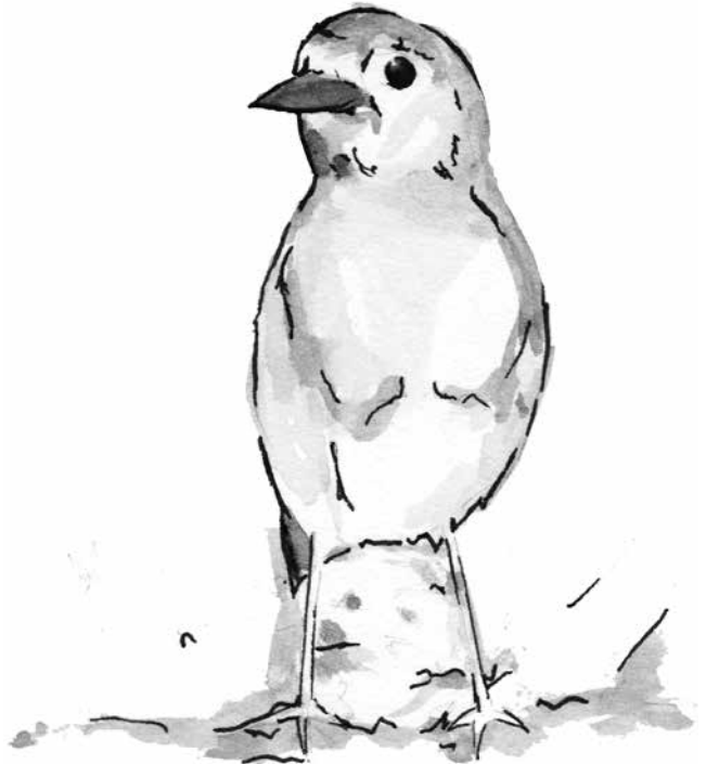
Illustration: Miriam Distel

A llen Geburtstagskindern wünschen wir einen wunderschönen Tag und Gottes reichen Segen für das neue Lebensjahr!